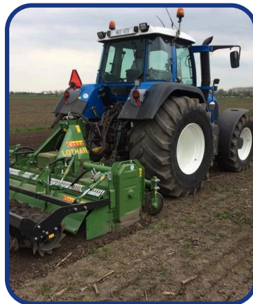
PREPARAZIONE DEL TERRENO